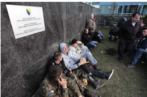
Protesti demobiliziranih vojnika ispred Parlamenta BiH

Bosna i Hercegovina nema instituciju zaduženu za prikupljanje fiskalnih podataka, konsolidaciju opće i centralne vlade niti jednoobrazne fiskalne izvještaje usklađene sa međunarodnim standardima. Legislativa ne predviđa obavezu dostavljanja mjesečnih fiskalnih podataka fiskalnim vlastima. Kvartalni i godišnji fiskalni podaci pripremaju se i dostavljaju nadležnim entitetskim ministarstvima finansija, ali često sa zakašnjenjem pa su bilo kakve intervencije neuspjele. Mjesečni izvještaji, kao i konsolidacija centralne i opće vlade, sačinjeni su u ad hoc maniru i trenutno se nalaze u slijepoj ulici. U isto vrijeme izvještajne jedinice preopterećene su izradom tuceta izvještaja sličnog sadržaja za različite korisnike. To znači da, dok se u drugim zemljama provode mjere štednje, mi ne znamo koliko novca zarađujemo niti koliko novca trošimo, i na šta. Ustvari, ne znamo šta generiše naš prihod niti ko su naši najveći potrošači. To nas ostavlja bez kormila u uzburkanom moru. Pitanje koje proizlazi iz ovoga je: Da li postoji stvarna potreba za fiskalnim podacima u Bosni i Hercegovini?