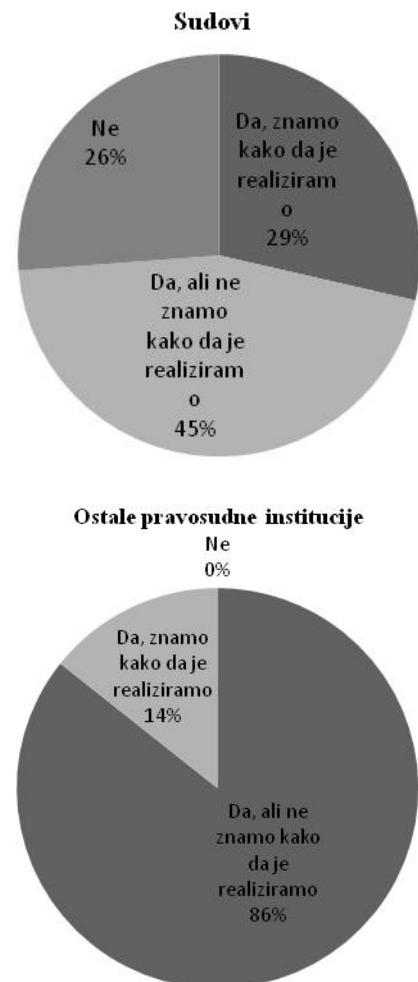
Grafikon 2: Interes za razvoj bolje saradnje sa NVO