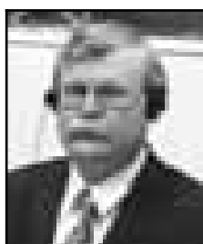
MIROSLAV TADIĆ Osuđen za progone

● pomagao je i podržavao deportaciju nesrpskih civila iz opštine Bosanski Šamac. Iz njegovog znatnog djelovanja na takozvanim "razmjenama" može se zaključiti da je njegova namjera bila da se ti civili ne vrate, odnosno, da je u najmanju ruku znao da njegovi postupci vjerovatno mogu da prouzroče trajno raseljavanje tih nesrpskih civila.