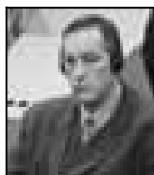
DUŠKO SIKIRICA Osuđen za progone

Od 14. juna do 27. jula 1992. Sikirica je bio komandant obezbjeđenja u logoru Keraterm na području Prijedora, na sjeverozapadu Bosne i Hercegovine.