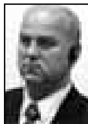
VLADIMIR ŠANTIĆ Osuđen za progone, ubistvo i nehumana djela

● aktivno je učestvovao u vojnom napadu na civile u selu Ahmići tokom kojeg je preko 100 civila ubijeno, a 169 muslimanskih domova je porušeno. Njegovo prisustvo na mjestu napada, kao lokalnog zapovjednika "Džokera" i vojne policije, poslužilo je kao ohrabrenje njegovim podređenim da počine zločine.