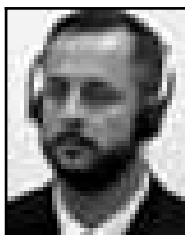
ZORAN KUPREŠKIĆ Oslobođen krivice

Bio je pripadnik Hrvatskog vijeća obrane (HVO) u srednjoj Bosni i Hercegovini.