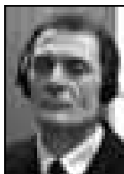
DRAGOLJUB KUNARAC Osuđen za mučenje, silovanje i porobljavanje

Tokom relevantnog perioda, Kunarac je bio zapovjednik specijalne izviđačke jedinice vojske bosanskih Srba (VRS), koja je sačinjavala dio lokalne Fočanske taktičke grupe.