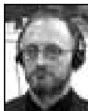
ZORAN VUKOVIĆ Osuđen za mučenje, silovanje i porobljavanje

Bio je jedan od zamjenika komandanta vojne policije vojske bosanskih Srba (VRS) i pripadnik paravojskih jedinica u gradu Foči.