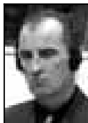
RADOMIR KOVAČ Osuđen za porobljavanje, silovanje i povrede ličnog dostojanstva

Bio je jedan od zamjenika komandanta vojne policije vojske bosanskih Srba (VRS) i vođa paravojnih jedinica u gradu Foči.